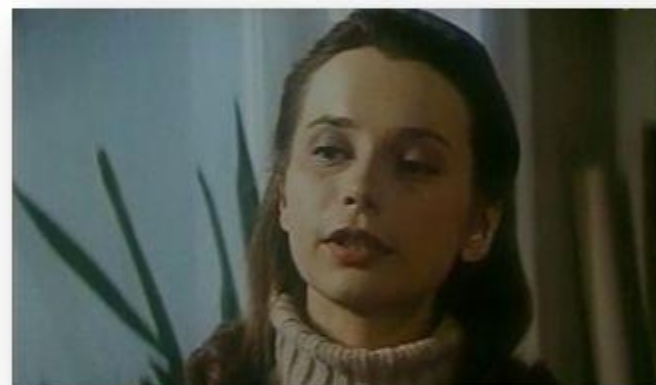
х/ф «4:0 в пользу Танечки» (1982г.)