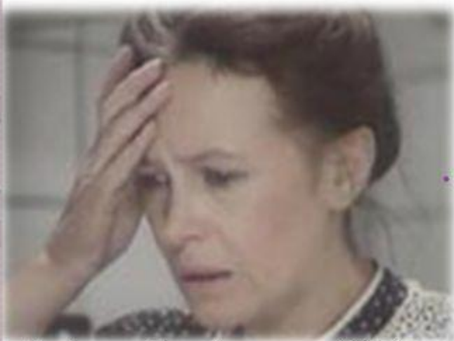
х/ф «Дорогая Елена Сергеевна» (1988г.)