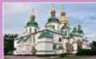
Собор Святого Николая в Киеве, Украина

объект всемирного культурного наследия ЮНЕСКО