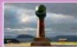
Площадь Незалежності в Киеве, Украина