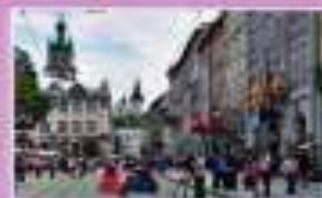
Исторический центр Львова, Украина