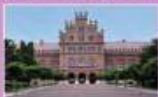
Успенский собор Киево-Печерской лавры, Украина