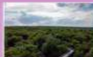
Древнейшая буквеная лесостепь в Карпатах, Украина