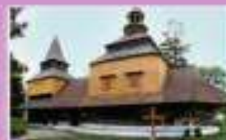
Деревянная церковь Святой Троицы в Хуцульском стиле, Украина