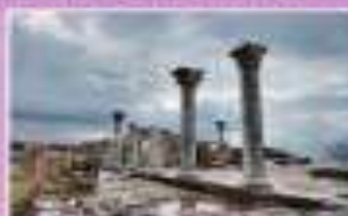
Древний город Помпеи, Италия